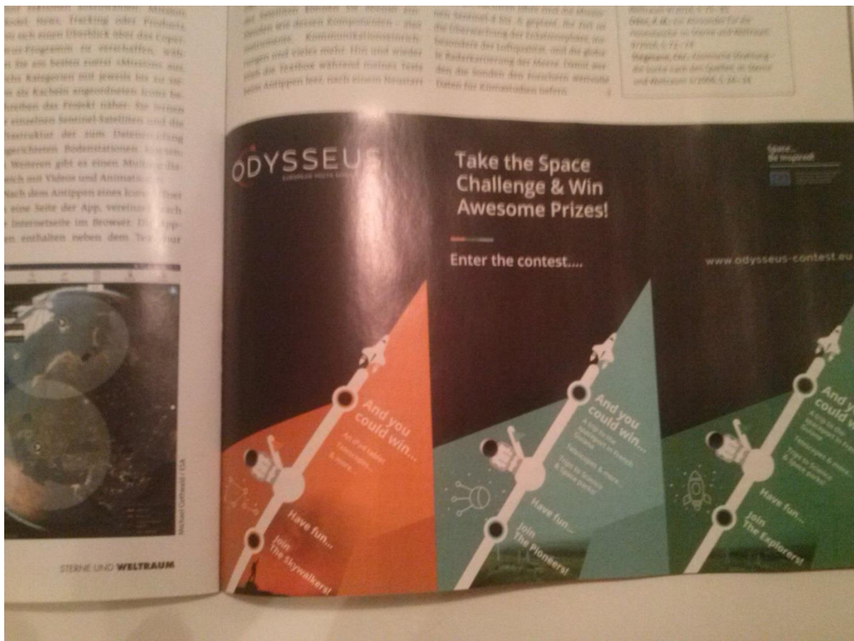
In: Sterne und Weltraum, Spektrum der Wissenschaft, 12/2016